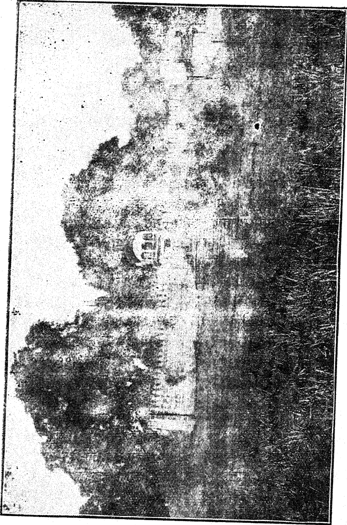
हरसिद्धि देवी का मन्दिर